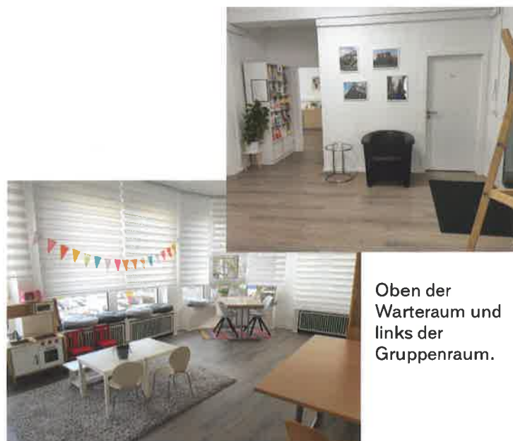
Oben der Warteraum und links der Gruppenraum.

Wir danken der Stadt Wuppertal, dem Inner-Wheel-Club und der Brennscheidt-Stiftung für die finanzielle Unterstützung hierbei!